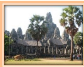
Photo : temples Bayon

Angkor-Thom qui se compose de : Le Bayon, le Baphuon, la Terrasse des éléphants, l'ancien Palais Royal, la Terrasse du roi lépreux, le Phimeanakas, le Chau Say Tevada, le Thommanon, le Tanei et le Takeo ( L'ensemble de ces sites se situe dans un périmètre restreint )