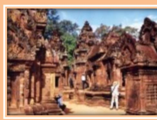
Photo : Banteay Srei

8h00 : Rendez-vous avec votre guide à la réception de l'hôtel.